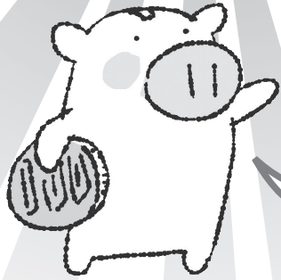
この本の案内人 チャリブー

エリック・ブラウン&サンディ・ドノバン 著 訳 上田勢子 イラスト まえだたつお