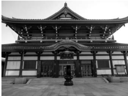
第1番高野山東京別院(港区)

ひとあじちがう寺院遍路で東京を再発見! 四国八十八ヶ所霊場巡りの御利益が東京で得られるんです。 「御府内八十八ヶ所」の完全ウォーク記録。