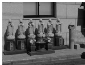
第34番三念寺の六地藏(文京区)