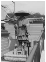
第56番与楽寺の弘法大師像(北区)