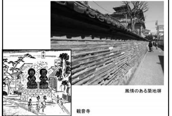
風情のある築地塀