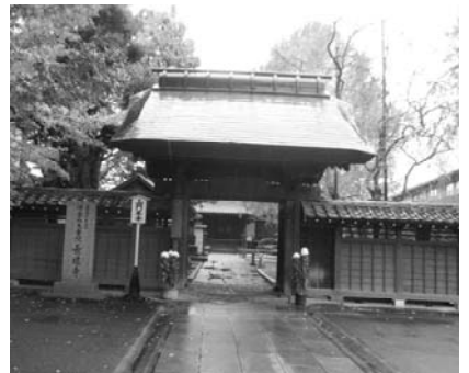
第8番長遠寺(大田区)