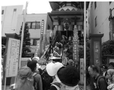
第23番薬研堀不動院(中央区)

朝倉彫塑館の前を通り七面坂を降りると谷中銀座商店街である。狭い道の両側に商店街がありにぎやかである。商店街の中に七つの木彫り猫の像が隠れており、これを探すのが人気のイベントになっている。私も探してみたが、屋根の上の二匹はすぐ見つけたが、意外なところにある。