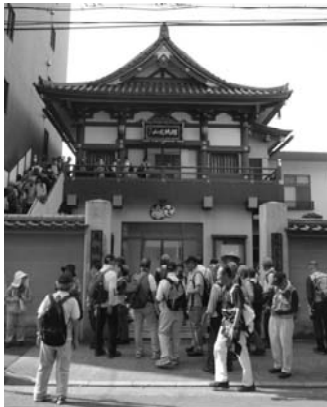
第37番萬徳院(江東区)